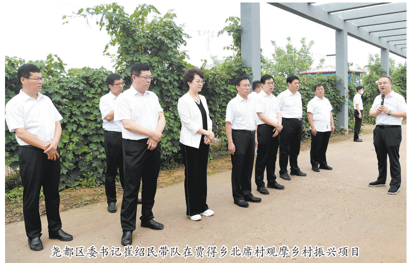
尧都区委书记崔绍民带队在贾得乡北席村观摩乡村振兴项目