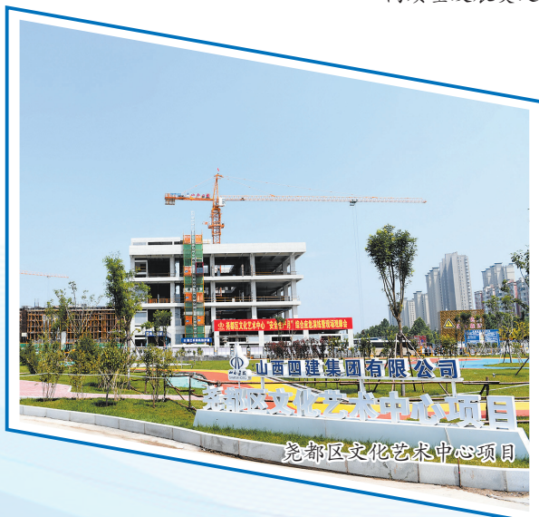
尧都区文化艺术中心项目