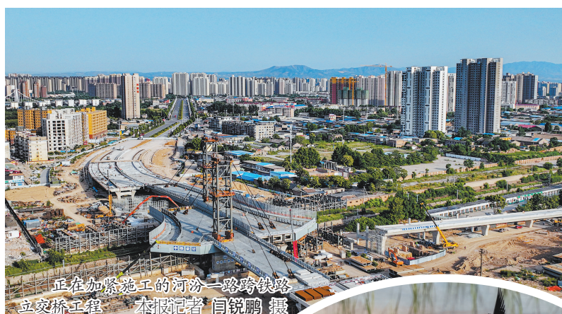
正在加紧施工的河汾一路跨铁路立交桥工程

社会化、法治化、专业化水平。 改革开放新高地。 坚持以改革为动力，以开放促发展，推进重点领域改革，持续放大改革效应；积极融入京津冀协同发展、山西中部及中原城市群，主动对接长三角、粤港澳大湾区，深化区域交流合作，抢抓新发展格局带来的重塑性机遇，在更大范围、更宽领域、更深层次走出去、引进来，不断培育内陆地区改革开放新优势。 营商环境最优地。 坚持市场化、法治化、国际化，展现真心实意，拿出真招实招，落实好“三无”“三可”要求，深化“放、管、服”改革，建立起“亲”“清”新型政商关系，打造公平公正的法治环境、高效便捷的政务环境、诚实守信的信用环境、开放文明的人文环境，让企业家专心创业、放心投资、安心经营，努力使尧都成为投资洼地、兴业沃土，让安商亲商富商在尧都蔚然成风。 要素资源集聚地。 坚持要素资源供给和产业发展相结合，依托中心城区金融机构集中、金融信息灵敏、金融服务高效的优势，促进金融资源向实体经济倾斜，充分发挥金融对经济的支撑作用；完善人才引育留用机制，构建政策支持体系，为各类人才尤其是青年人才创新创业提供理想栖息地；以云商产业园为载体，积极发展数字经济，大力推动数智赋能，加快数字产业化、产业数字化，让资本、人才、数据等要素资源在尧都充分集聚，为推动全方位高质量发展奠定坚实基础。