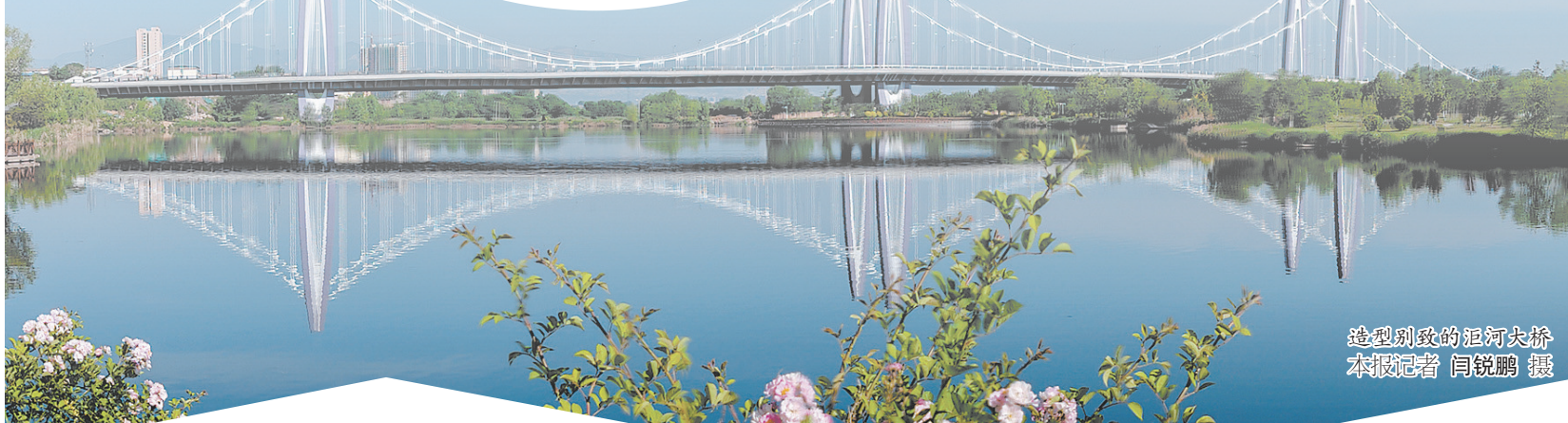
造型别致的巨河大桥