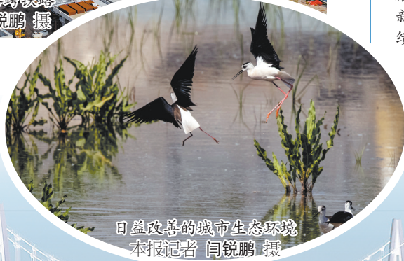
日益改善的城市生态环境