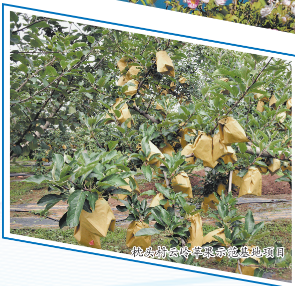
枕头村云岭苹果示范基地项目