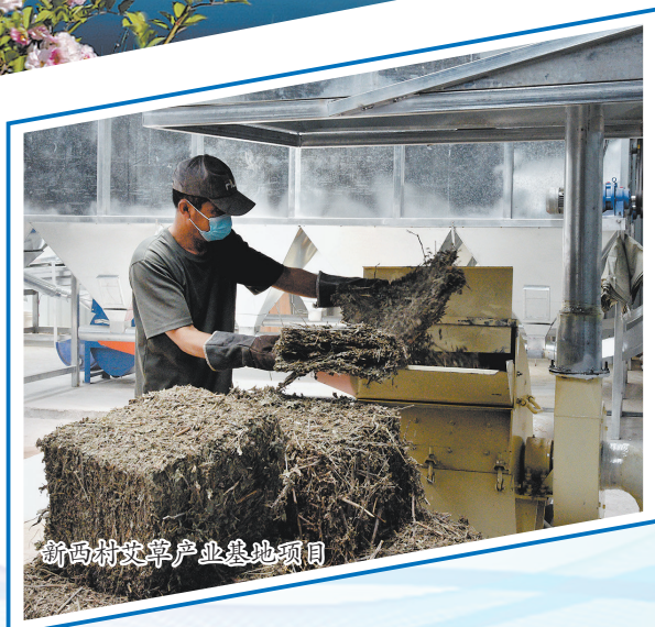
新西村艾草产业基地项目